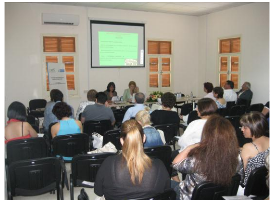
Στιγμιότυπα από εκδηλώσεις του ΕΑΔ