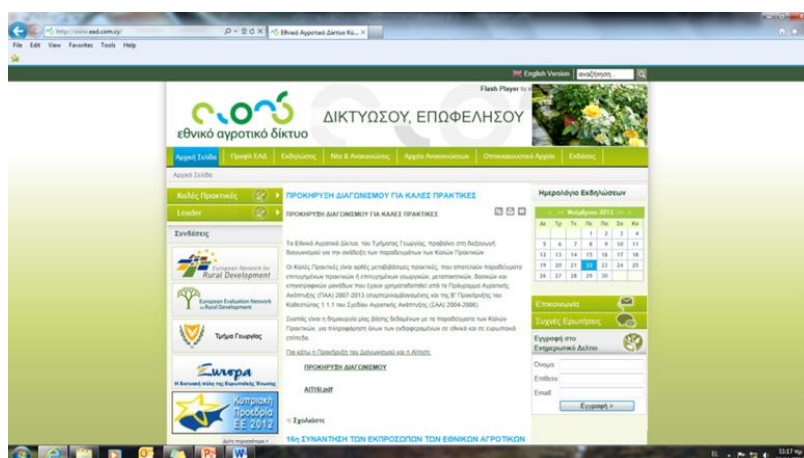
Η ανακοίνωση για την Προκήρυξη των Καλών Πρακτικών

Η Προκήρυξη μαζί με την Αίτηση των Καλών Πρακτικών αναρτήθηκαν στην ιστοσελίδα του ΕΑΔ, καθώς και στις ιστοσελίδες του Τμήματος Γεωργίας και του ΚΟΑΠ.