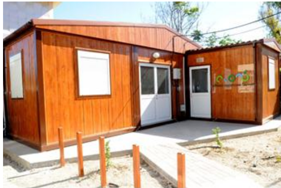
Το νέο κτίριο του ΕΑΔ

Κατά το 2012 το ΕΑΔ μετακόμισε σε κτίριο στο χώρο των κεντρικών γραφείων του Τμήματος Γεωργίας, στη Λεωφόρο Λουκή Ακρίτα, 1412 Λευκωσία.