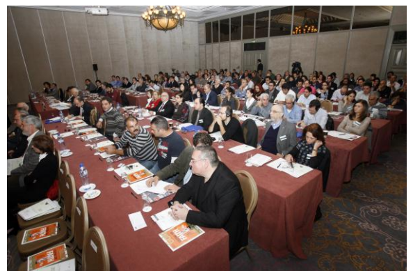
Στιγμιότυπα από το Φόρουμ της Κοινής Αγροτικής Πολιτικής