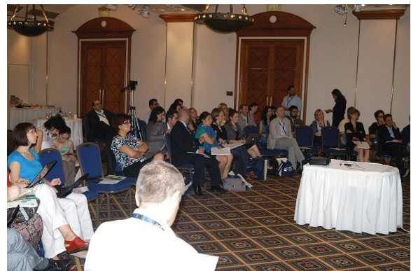
Στιγμιότυπα από τη 16 η Συνάντηση των Εθνικών Αγροτικών Δικτύων