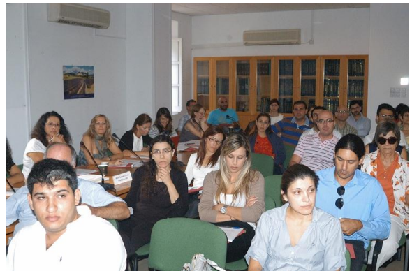
Στιγμιότυπα από τη 2 η Συνάντηση των εκπροσώπων των Εθνικών Αγροτικών Δικτύων της Μεσογείου