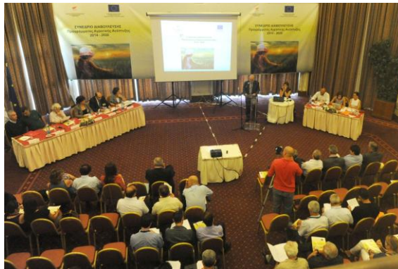
Στιγμιότυπο από το Πρώτο (1 ο) Συνέδριο Διαβούλευσης Προγράμματος Αγροτικής Ανάπτυξης 2014-2020

Σε συνεργασία με την ΔΑΠΑΑ διοργανώθηκε στις 21 Σεπτεμβρίου 2012 το πρώτο Συνέδριο Διαβούλευσης του Προγράμματος Αγροτικής Ανάπτυξης 2014-2020 στη Λευκωσία. Στο Συνέδριο προσκλήθηκαν τρεις καθηγητές από την Ελλάδα οι οποίοι ανέπτυξαν θέματα για τις Στρατηγικές Κατευθύνσεις για την Αγροτική Ανάπτυξη.