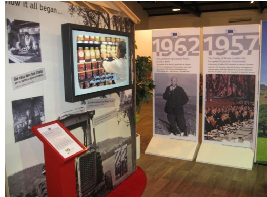
Στιγμιότυπα από την Έκθεση για τα 50χρονα της ΚΑΠ